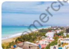
Santa Elena, Ecuador.

Regresaron a sus ciudades 1 220 turistas.